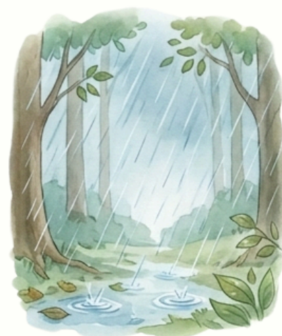
Elered az eső