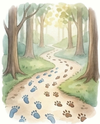
Rejtélyes lábnyomok az erdei ösvényen