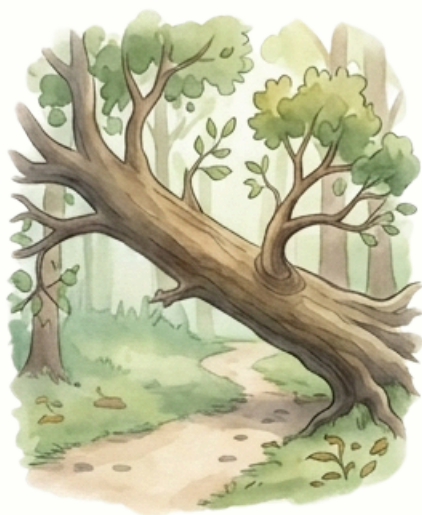
Hirtelen útját állja egy kidőlő fa