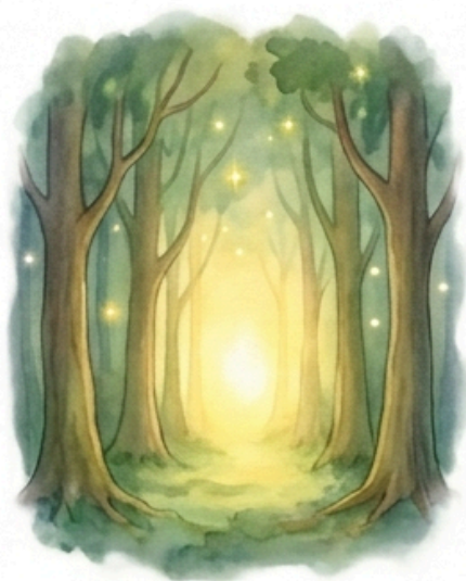
Furcsa fény villan a fák között