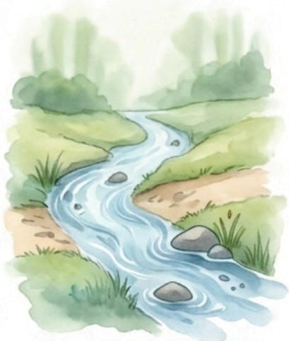
Megárad a patak