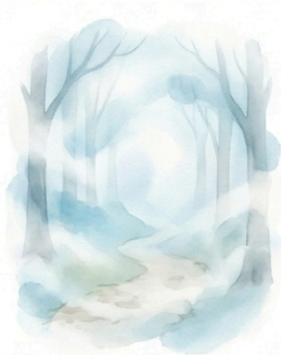
Sűrű köd borítja a tájat