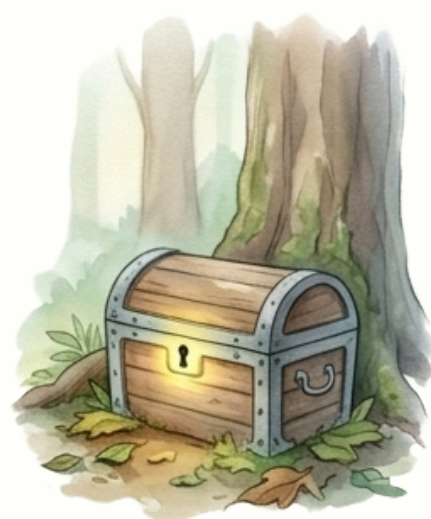
Előbukkan egy titkos láda