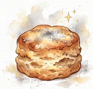
Hamuban sült pogácsa