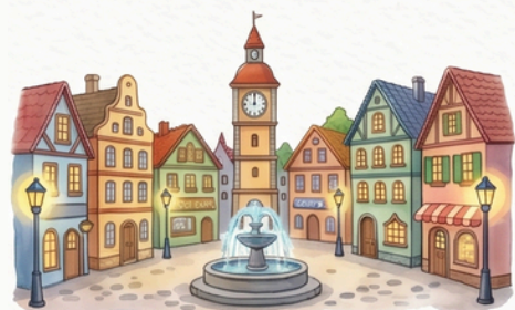
A város főtere