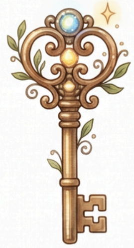
Mindent nyitó kulcs