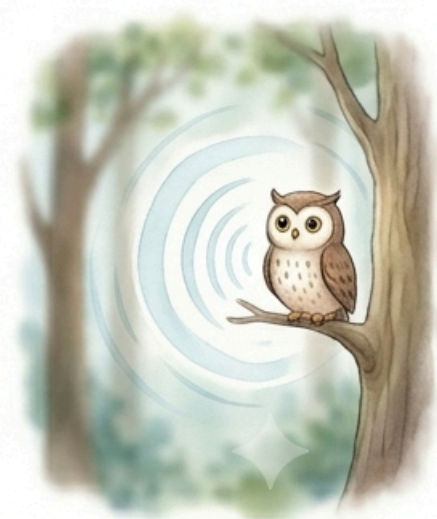
Furcsa nesz hallatszik a fák közül