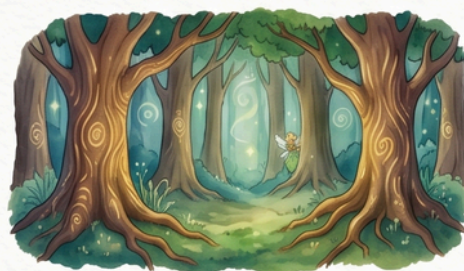
A titkos tölgyerdő